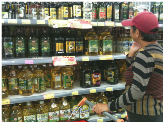
食安危機層出不窮，民眾購物時充滿擔憂。

擔心食品安全的不只消費者，連生產者本身都備感壓力。作為始作俑者的上游廠商不難逃過關廠和吃官司的命運，連部分下游的商店亦將成為池魚之殃，面對上游的原料問題，下游必須一肩扛起所有風險和損失，生意往往會一落千丈，只能透過檢驗局的相關報告，在店裡掛上合格的告示並期待重拾消費者的信任。