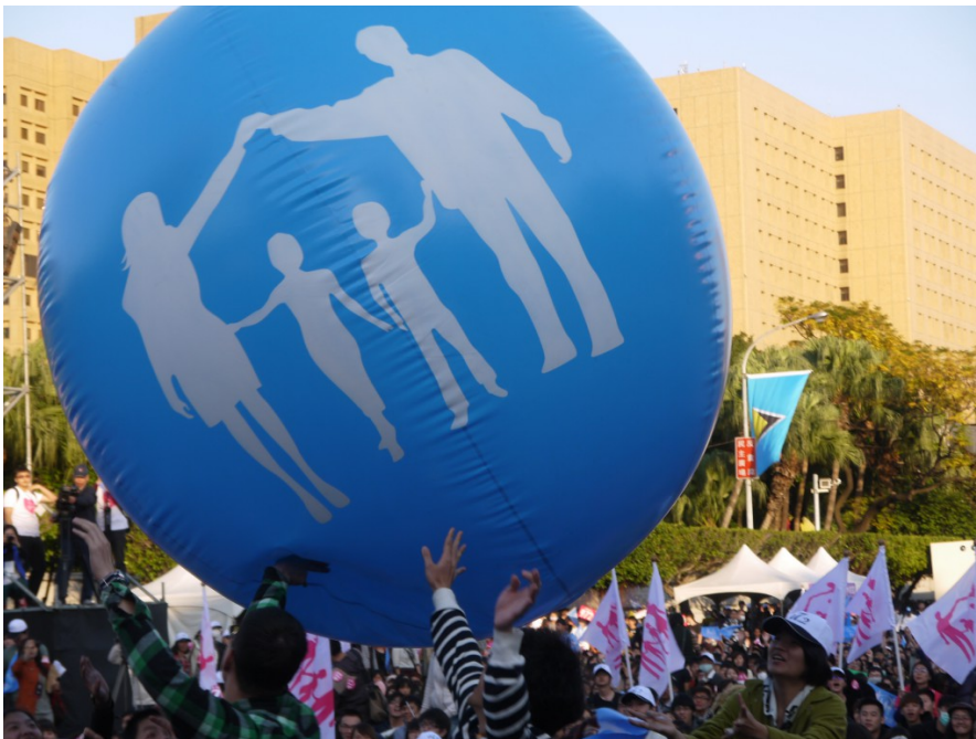
主辦單位拋下象徵圓滿家庭的幸福球讓民眾傳遞。