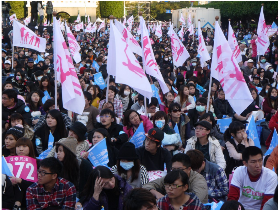
參與遊行的民眾達近三十萬人，人人手中揮舞著主辦單位發送的旗幟。

由幸福聯盟所發起的「為下一代幸福讚出來」大遊行於十一月三十號在凱達格蘭大道上浩大展開。這次遊行的訴求是反對修改自民法九百七十二條為首，各項與規範親屬關係相關的法條，包括以婚姻平權為名的多元成家法案。參與的名眾來自台灣北中南東各地區，高達近三十萬人，其中更有多名立委、法政權威、藝人響應，決心捍衛傳統家庭價值。現場讓各界人士上台陳述意見，提供一個給人民發聲的機會。