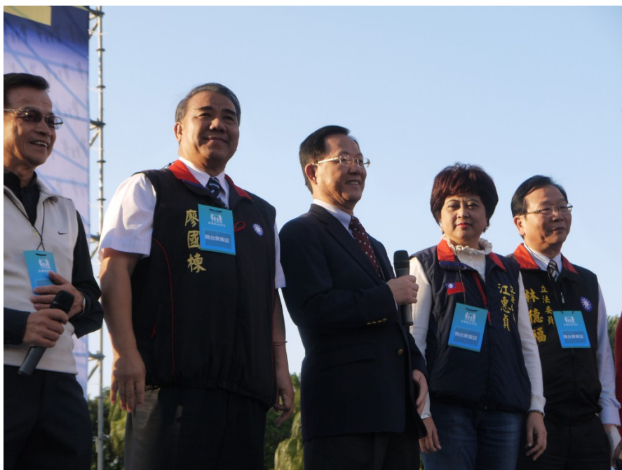
許多立委和在场民眾站在同一陣線，並答應會在立法院做最後的把關。