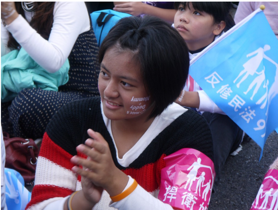
台下的人幫台上的表演者打拍子，不亦樂乎。