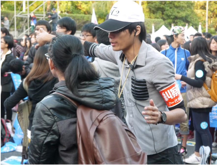
現場有許多糾察員維護秩序，引導參與民眾正確的動線。