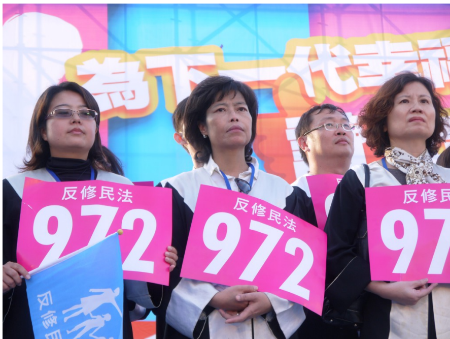
身穿律師袍，為民喉舌的律師也反對草率修改民法。