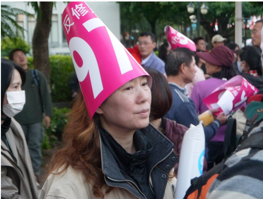
有參與者將主辦單位發放的標語戴在頭上，決心要為家庭價值奮戰到底。