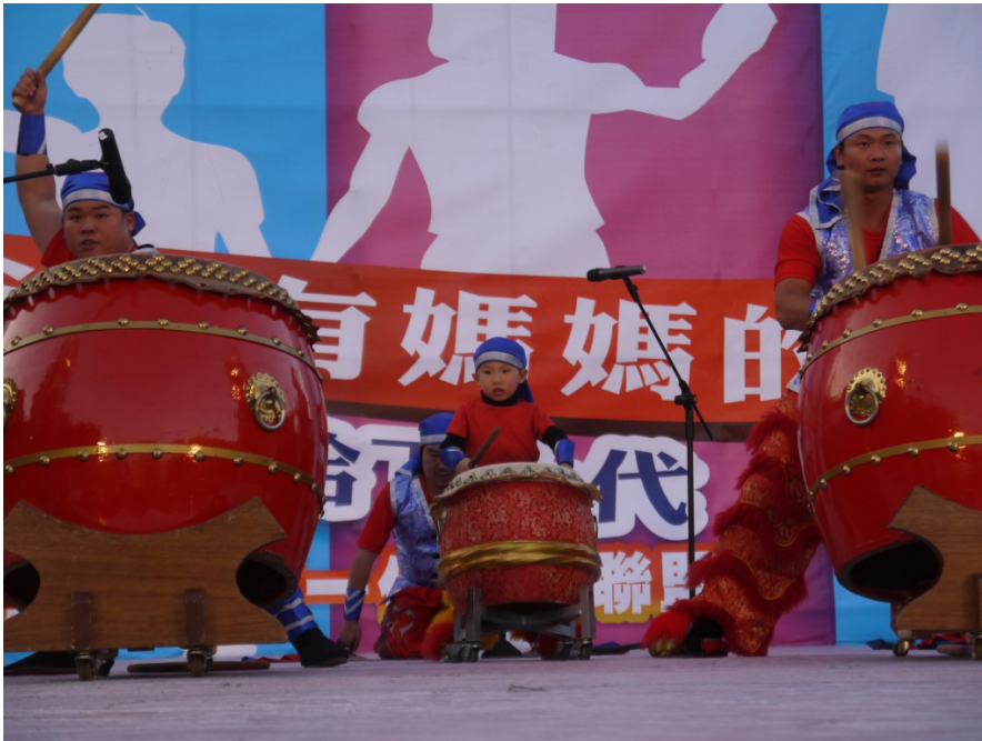
現場還有精彩的歌舞打鼓表演，中間的小弟弟十分賣力地擊打著大鼓。