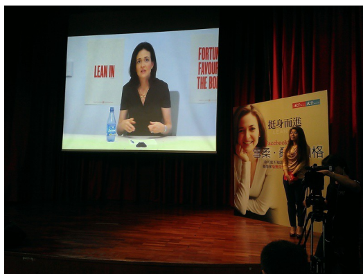
雪柔·桑德伯格與北一女學生進行視訊對談的現場。

雪柔將《挺身而進》一書的所有版稅全數捐出，用於成立lean in基金會，鼓勵女性朋友，可以八到十人成立一個學習圈，互相幫助給予彼此建議。九月中時雪柔與北一女中的學生們進行台灣首次的跨海對談，演說一開始，雪柔便利用書中的觀點，倡導三個原則：「破除刻板印象」、「除非離開職場，否則全力以赴」、「相信自己」。