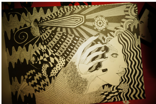
短詩〈自由〉篇中，子宮頸Yen的話中話，帶有強烈的隱喻性。

以抽象的插畫輔佐淺白的文字，黑白影像中不忌諱地使用男女性器官來表達，〈自由〉篇章中提到「如果你有翅膀 你會想當飛鳥還是蝴蝶？」，看似簡單的文句，搭配上女子捧著帶有乳房的蝴蝶與叼著陰莖的飛鳥，跳脫有色眼光的詮釋方法，更同時達到製造「無盡寓意」的想像空間。