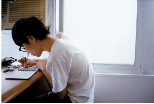
子宮頸Yen實為一位男性作家，卻常為女性議題發生。

而男性是否能確切地表達出女人內心的想法？根據自由時報二〇一三年二月的專訪，子宮頸Yen表示身邊許多女性朋友，提及不少愛情問題與價值觀。透過平時對於女性主義的觀察，他呼籲女性應更加愛護自己，男性則要加倍關心對方。《女·性Féministe》的言語立場顯著，但男女腦部先天結構便不相同，女性情緒邏輯也如同心理研究指出，在表達能力和思維延續性皆較為敏銳，子宮頸Yen在此書的概念傳達，是否會造成女性對男性的觀念謬誤，抑或能達到最初反轉男性價值觀的目的，仍相當具有爭議性。