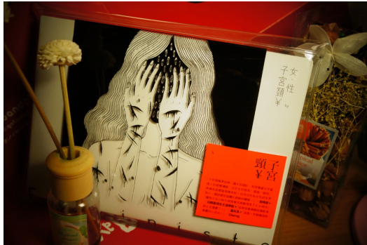
外層包裝多了塑膠設計，象徵緊密的女性思維即將揭開。

當陰唇與陰莖不再只是遮掩的私密，而男女性別也顛覆舊有的邏輯，佐以短詩與插畫而成，圖文集《女·性Féministe》道盡「女」在社會框架中的反抗和異議。簡單口語又不失力道的筆觸，搭配上具有衝擊力的插畫表現，打破以往墨守成規的傳統道德作風，在時代呼聲高漲的作用下，擁有「女人心」的所有男女個體，從「女」和「性」的觀點出發，看盡一生內心最底層的蘊釀。