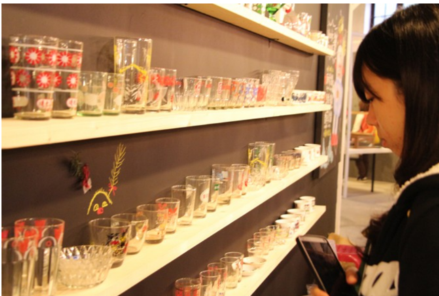
展場內，並不是所有東西都是「設計品」。這滿牆的玻璃杯，是攤主多年來的收藏，屬於台灣經年累月的創作