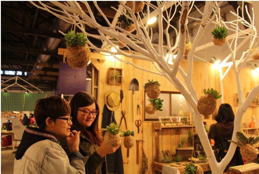
設計巧思不僅僅是為了好看或賣錢，更是希望能引起大眾的興趣和深思。