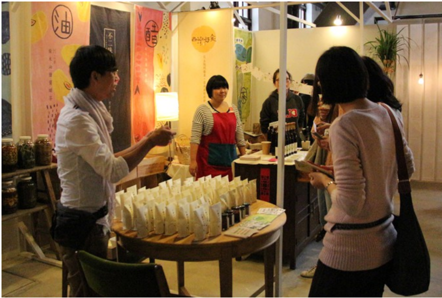
透過精巧的布置引起過路者的興趣，攤主述說自己對台灣人和地的熱愛。