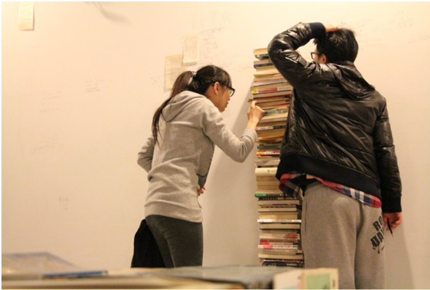
牆邊靠著一本本書，是一本本屬於台灣的記憶，疊起來，看看記錄了多少個歲月。