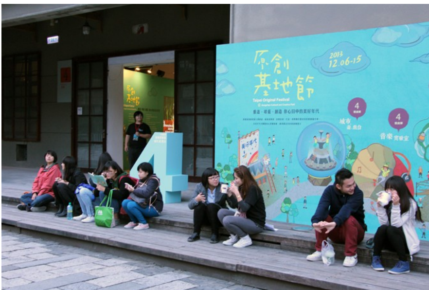
在松山文創園區舉辦的「原創基地節」，以「美好年代」為策展概念，期盼能引起大眾對台灣的感動。