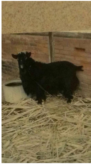
黑色山羊後來便因不敵環境的變化而夭折。