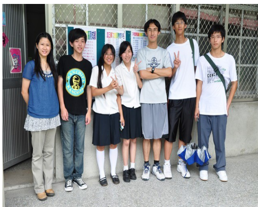
國中時期的老師與瘋寫網誌的友人們。