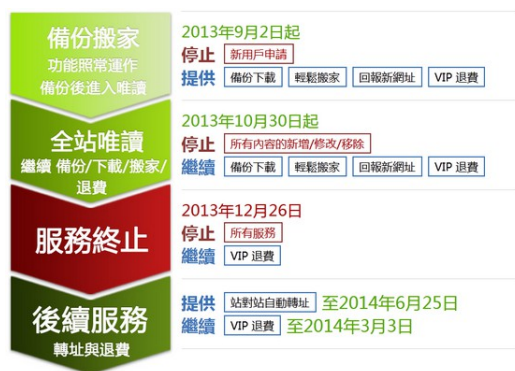
無名小站備份流程。

起初，備份工作進行地不太順利，先是圖片連結失效，造成死檔，經過我多次上傳仍舊無用，著實使人灰心，負面想法排山倒海而來，「這該不會是上天的指示呀？過去就過去了，不用刻意備份？」我自問。