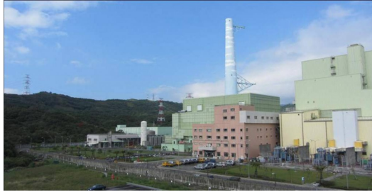
龍門核能發電廠，又名核四廠，是《零地點》此書主要描述的真實場景。

全書的主要角色都是虛構的人物，像是林群浩、女友小蓉、育幼院老師玲芳、醫師李莉晴、核安署署長賀陳端方等。書中也安排臺灣現實社會中的人物來面對虛構的核災，例如余莓莓、劉寶傑、戴立忍、馬英九、蘇貞昌等等，這些人物除了能扮演與真實世界連結的角色外，作者也會藉此以幽默的筆法來嘲諷當今社會。