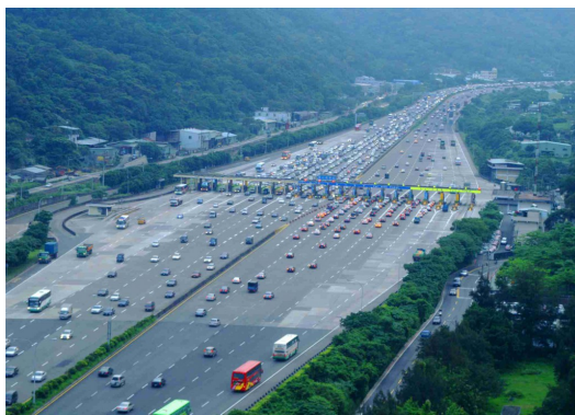
收費站成為我確認所在地的好根據。

在沒有智慧型手機的年代，觀賞車外風光成為消磨五小時車程的唯一方法。桃園到屏東，幾乎跨越整個台灣西部，當時我對台灣的地理還沒什麼概念，「收費站」是我用來確認所在地的方法，經過八個收費站，就會離開高速公路，再走一小時的平面道路，就能到外婆家。後來漸漸長大，開始會認一些有名的地景，像是苗栗的火炎山、台灣最長的濁水溪等。