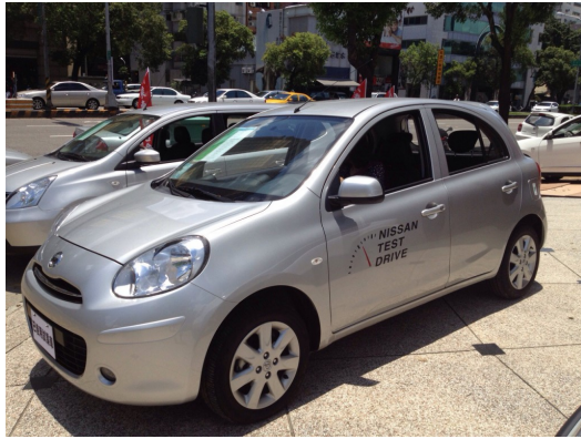
姊姊和爸爸一起去買車時，用手機傳來的照片。

大二下學期末時，也許爸爸是害怕我騎機車太危險，竟突然告訴我，他買了一輛車要給我開。當時我只覺得爸爸一定是在開玩笑，平時省吃儉用，連買一件外套都要想老半天的爸爸，怎麼可能沒事突然買輛車？然而，沒多久以後，姊姊用手機傳來的照片，更明確的告訴我這不是幻覺。