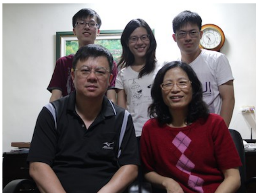
大學以後，家人都有許多瑣事，難得全家能夠在不是節慶的日子相聚。

我高中就離開自己生活最久的家鄉，這讓我變得更獨立，卻也更脆弱。我和家人相處的時間變得很少，越長大越覺得每次回家見到家人都像見到路人般的陌生。回家看父母變得像例行公事，因為生活費用完，所以才回家。別人說家的溫暖，對我來說好像只存在於童年的印象裡。雖然父母對我還是很很好，但是總覺得這些最親近我的家人，漸漸變得像是那些逢年過節才會見到一兩次的遠親。