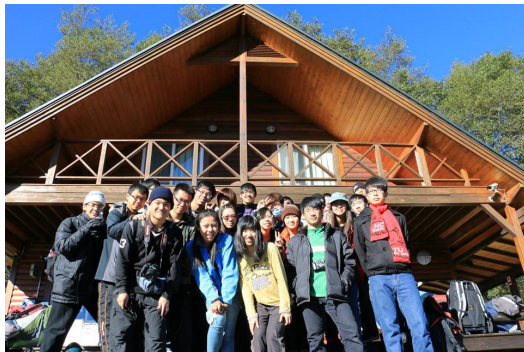
登山前，同學們一起在雪山登山口合影。

但再怎麼有趣的活動也必須更新，因此這學期我和教授討論了許久，決定不僅僅是離開3C用品，而是離開交大這個大家已經習慣的校園。人在同一個地方待久了思考會停滯或無法跳脫，而課業壓力下同學們最難有機會去的地方就是戶外，因此選了離新竹最近的雪霸國家公園。