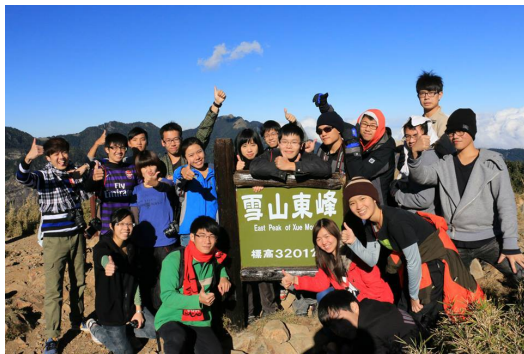
雖然歷經數小時的登山，站上峰頂，同學們都非常雀躍。

這次登山最大的心得，應是在大山前要謙卑。壯絕的風景裡，會體悟到自己的渺小。一次又一次轉彎然後柳暗花明的感受，是大自然送給人類最棒的禮物。站在峰頂的時候，俯瞰山下一切，仔細想想，如果不是站在大山的頭上，我們又怎能看見如此美麗的景緻。