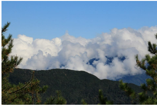
行前再多辛苦，望著這樣的雲海，一切已值得。