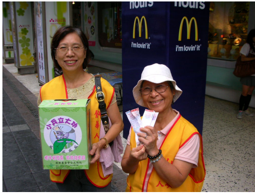
志工們在街頭募集發票。