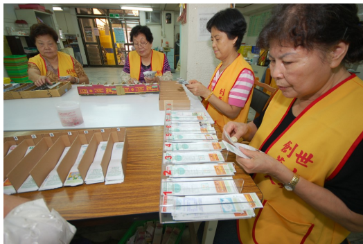
志工們以尾數分類的方式來整理發票。

光有大眾的發票捐贈是不夠的，更重要的是人力資源，也就是志工。民眾把發票投進發票箱後，需要靠志工去收回每個發票箱的發票，然後再按尾數分類發票並對獎，中獎的發票需要換錢，沒中獎的還需整理起來回收，每一筆中獎的金額都需要明確記錄，所有步驟都是志工們一手包辦，因此志工的需求量非常龐大。