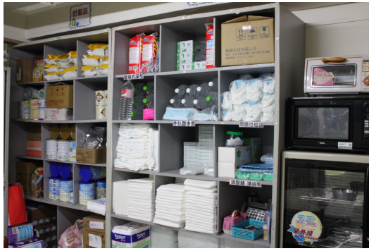
植物人需要尿布、奶粉等大量的消耗品。