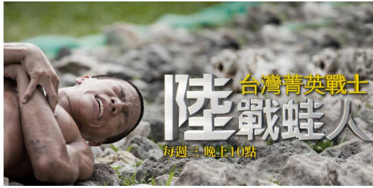
國家地理頻道推出的【台灣菁英戰士：陸戰蛙人】將在三十多個國家播出，讓更多人看見台灣。

近幾年來，台灣的國家地理頻道除了一貫的播放國外的紀錄片之外，從二〇〇四年起也積極培養台灣自己的紀錄片團隊，以國際的製作能力來挖掘台灣觀眾感興趣的在地觀點，也頻頻在國際影展中獲得肯定，今年推出的【台灣菁英戰士：陸戰蛙人】系列紀錄片不僅在台灣大獲好評，未來也將在三十多個國家的頻道播出，讓更多人看見台灣。