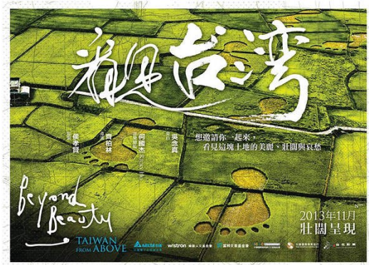
齊柏林的首部空拍紀錄片【看見台灣】獲得紀錄片史上最高的1.7億票房佳績。

以往紀錄片大多在影展中播放，主打小眾市場，但今年卻一共有十一部紀錄片躍上大螢幕登上院線，打破往年的紀錄。而其中素人導演齊柏林的【看見台灣】更創下台灣紀錄片史上最高的1.7億票房佳績，以收容所流浪狗為主題的【十二夜】也在上映三周後達到五千萬。因此，二〇一三年被台灣紀錄片工作者稱作是「豐收的一年」。