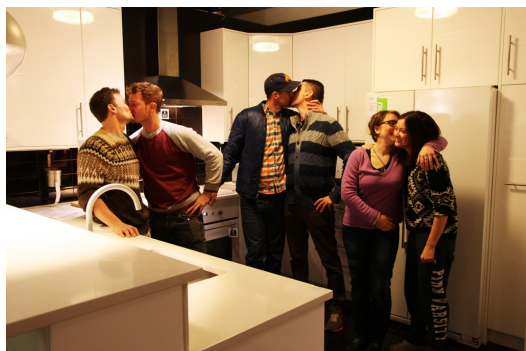
同性戀議題於國內外都是話題的焦點。

同性婚姻如今在國內外都是話題的焦點，但是倒退一步，在校園中的多元性別議題，是否有受到重視？民國八十九年葉永鈺事件可作為一個里程碑，讓當時正在研擬的《兩性平等教育法》更名為《性別平等教育法》，並增定條文第十四條：「學校不得因學生之性別、性別特質、性別認同或性傾向而給予教學、活動、評量、獎懲、福利及服務上之差別待遇。」