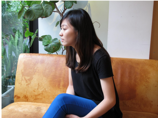
三耳喜歡靜靜地聽，看似發呆的生活卻感受到許多外在生命力。

有一個女孩擁有三隻耳朵，因此大家都叫她三耳，多出一隻耳朵使她善於傾聽，善於感受世界上大大小小的「聲」命。二十多年來，三耳聽過的故事好多，多到小小的腦袋時常承載不住，不是忘了就是姑且想不起來，卻也因為這個美麗的誤會，其他的小耳朵們時常把三耳當成保守秘密的對象。但時間久了，三耳變得只會靜靜地聽，心裡的話卻怎麼也說不出口。