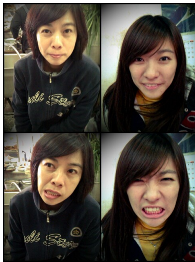
三耳的母親是個相當活潑又喜歡搞怪的新潮媽媽。

儘管三耳的母親總是開玩笑的跟她說：「以前一直跟妳說不要結婚，結婚超麻煩的，不過妳現在應該也不用考慮這個啦。」，但卻依然可以從母親的關心中，看見她對三耳感情上幸福的期盼。