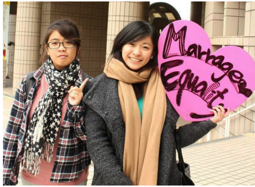
身邊每一個人都該喜歡自己的特別。