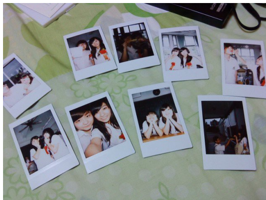
穿上制服的約束，相比內心最自由的奔放，屬於學生的嚮往。

但三耳的世界總是離奇顛倒，四年後的黑耳朵變成最親密的身邊人，一項遵守普羅社會價值觀的三耳，一腳踏入了從未接觸過的「女女生活」，起先這段秘密關係一直在三耳的內心封存，直到高中才有了變化。