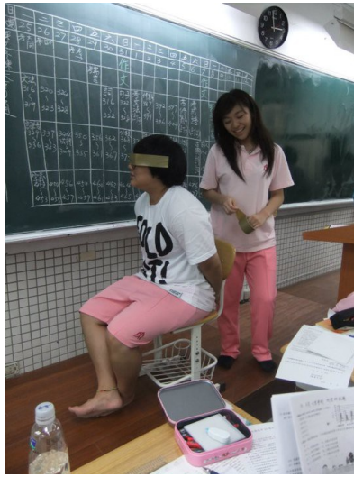
三耳和胖耳朵的組合相當奇妙，總是想出相當特別的點子。