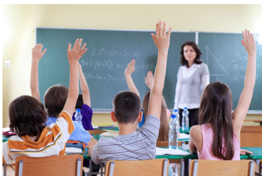
師資培育的課程中會教導如何運用教學策略，來激發學生的學習動機，並提升專注力。

而臺灣師範大學師資培育處的副教授黃嘉莉則指出，的確有一段時間老師會覺得不想管了，不能體罰要如何管學生？但在體制的改變下，教育學程的課程會教導師資培育生如何運用教學策略，激起學生學習的興趣，例如用電視劇或是時事來喚起學生的學習動機，穿插在課堂中，提升學生的專注力。在師資培育課程中也會安排老師與孩子做接觸，了解他們的語言與思維邏輯，熟悉如何和他們相處。