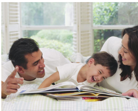
教育不只是老師的責任，家庭也是孩子的教育中很重要的一環。

對此，江昱明認為，孩子行為上的改變、好教還是難教，不能單單從體罰跟沒體罰的差別去解釋。因為現在社會氛圍跟以前不同，孩子也變得不一樣。他提出，教育的起點是在家庭，如果在家庭裡父母過度溺愛小孩，使他可以主導很多事情，那他到學校也會認為他擁有很多權力。他的成長背景就是如此，並不是因為老師沒有處罰才形成的。