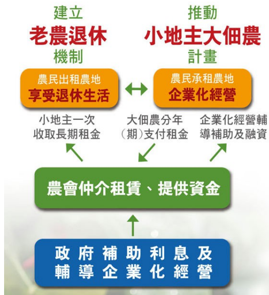
「小地主大佃農」政策示意圖。

其實變更使用或是進行開發，都不是農家最後的出路，但目前生態與生計的窘境，確實讓人反思當今農業政策以及土地規劃的缺失，期盼未來政府能有效改善現況，讓人民與土地共榮，回復過去單純美好的農村風景。