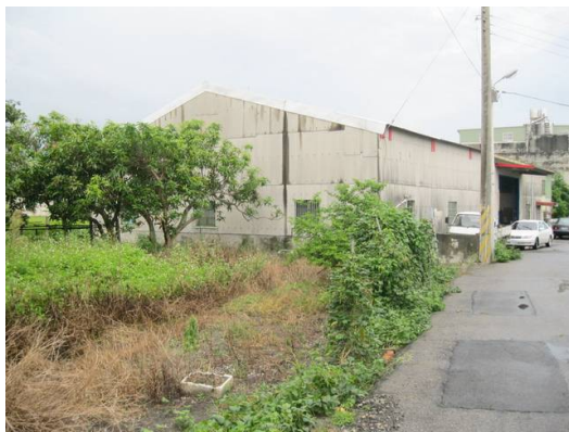
現在農村廠房林立，記憶中的稻香不再。

然而，放寬並不代表無法律管制，事實上現在許多郊區的鐵皮屋，都屬於違建的地下工廠，而有不少是農民投資興建，並出租作為經濟來源。這樣的行為著實違反規定，且有環境污染的疑慮，若經舉證屬實將獲處罰鍰，情節嚴重者更將受到強制拆除，在如此高風險的狀況下，農民仍願意鋌而走險投下老本，多數是基於生計上的考量。