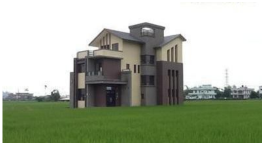
不只廠房，許多豪宅也打著「農舍」的名號使用農業用地。

不只是違建工廠，許多標榜是「農舍」的「豪宅」，也該是控管的對象。賴宗裕認為農舍本來就不該作為居住使用，家庭的廢水將成為不定點的汙染源，帶來的傷害不亞於工廠，政府該積極維持非都市土地的數量，讓農地維持農用。「農地的功能不只有糧食生產，還有生態、調節氣候等功能。」許多都市邊緣的郊區因土地零碎，無法進行大規模的生產，所獲利潤不高，成為土地轉型的誘因，但賴宗裕認為目前台灣農地日漸減少，能多留一塊淨土，就該盡力保護，不應犧牲環境，一味短視近利得開發。