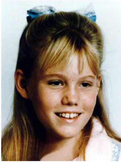
潔西被綁架時年僅十一歲，往後十八年她都在孤獨的環境中度過。