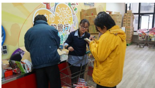
受助戶正在食物銀行裡面選擇食物、日用品。

何小姐則表示：「希望以後會有更多實體食物銀行，讓我們可以自己去挑選需要的食物和物資。」事實上，除了綠川店實體食物銀行可以任受助者挑選物資，其他發放站都是一包一包統一的物資，當中也可能會有自己不需要的用品。