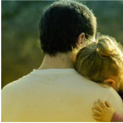
《在我離開之前》主角席佛緬懷昔日與女兒親暱的光景。

《在我離開之前》一書所刻劃的人物特質十分鮮明，在角色互動的過程中，寫下既心碎又搞笑的人生窘境，也藉由對於失意男子的深刻描繪，傳達雋永的意義：你永遠不可能重回過去時日，把人生過去的疏失和缺角修補好，卻可以把未來的人生過得更好。