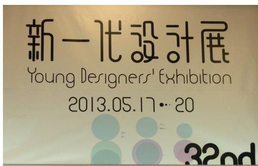
一年一度的新一代設計展總是有相當多的畢業生展出作品。

然而這一群大學生們畢業後，在求職與薪資的壓力下，繼續投身在設計界努力的學生們還剩下多少？