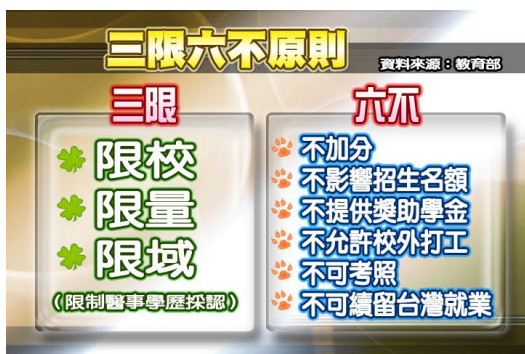
三限六不原則簡介圖表。

所謂的「三限六不」，分別限制了陸生在台灣的一切打工行為、不得申請獎學金和研究經費，更不可續留台灣就業等有關於「金錢」方面的事項，「三限」則指涉陸生的總數、居住區域、及學校是被嚴格管制的，如果不在政府認定區域內的學生，就無法申請來台就學。