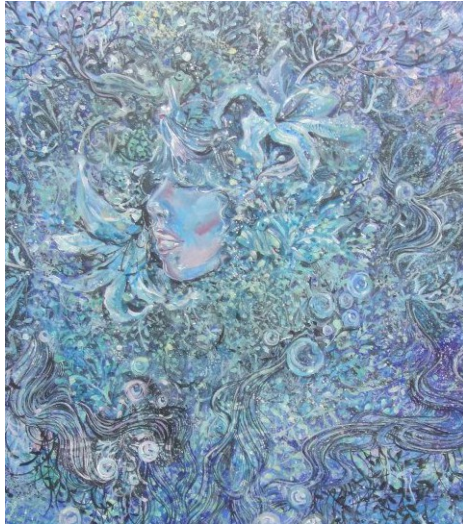
以藤曼為發想的女人肖像，不是一般端正挺直的肖像， 反倒充滿幻想色彩。