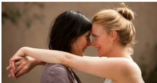
女性影展中也展出女同志電影【女孩轉個彎】。

大多同志電影以寫實的手法拍攝，描述伴侶在社會上的立足點、生活中的挑戰等。二〇一一年，瑞典電影【女孩轉個彎】以雙性戀女子周旋在家族婚姻和個人情感的掙扎為題材；二〇一二年，美國電影【為你流的淚】則描述男同志伴侶「永遠」在一起的壓抑情感；而二〇一三年，法國女同志電影【藍色是最溫暖的顏色】則是描述激情退去後，個性、觀念隨之而來相處上的考驗。