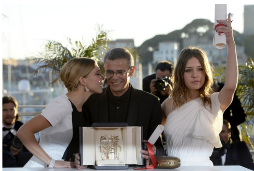
圖中男性即為導演阿布戴·柯西胥獲得金棕櫚獎，其他兩位為劇中女主角。

觀眾起初可能因難懂的文學語句，而認為部分劇情的乏味和冗長，但這些串聯在故事中的著作名言，正是描繪青春期Adele內心的矛盾糾結，只可惜透過不斷地翻譯和擷取的文學概念，在傳達抽象概念時依舊存在一些隔閡。