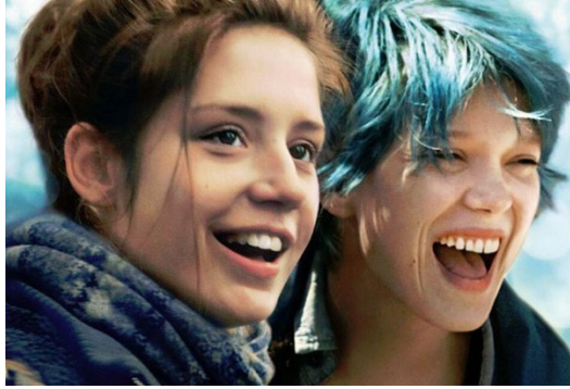
藍色的意象在劇中扮演著憂鬱與毫無畏懼的情感。

而【為你流的淚】則透過男主角一句「我認為我們會永遠在一起」，描述十年間因為生活型態的差異，不斷地折磨彼此的複雜情緒，經由這些相同要點，可見出同志感情和異性戀情感，最終皆為回歸到大眾面對的種種問題。