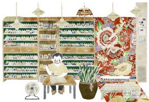
藉由細膩的筆觸，作者如實呈現職人的工作環境。

此外，《職人誌》的作者在美編設計則充分發揮專業的繪圖能力，尤其是每位人物的工作室全景圖，鉅細靡遺地呈現工作室內的每項作品、每個擺設等細節，一筆一畫讓人一目瞭然職人的工作環境與情形。因此，透過文字認識職人之餘，讀者將由插畫看見職人努力工作且堅持不懈的寫實面貌。然而，《尋百工》在美術設計方面，雖然缺乏色彩繽紛的手繪插圖，但每篇故事開端所印製的滿版人物工作照，亦傳遞著師傅認真工作的態度和神情。