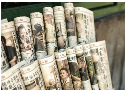
週記原本以報紙方式印製，最終集結成冊出版《職人誌》。

作者以一週一篇的週記形式呈現五十二項手工藝，《職人誌》則是整合所有週記所出版的書籍。書中每位職人與每項傳統技藝交織成一篇文章的故事，他們娓娓道來昔日接觸該行的生活背景、創作手工藝品時所遭遇的挫折、所具備特殊的專業技能以及對於傳統消逝的感觸等等心情。