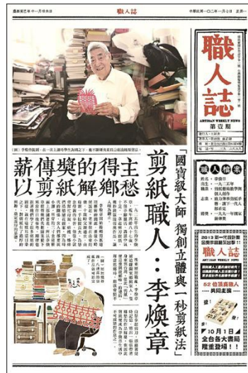
古早報紙的排版和鉛字印刷的字體，使本書獨具一格。