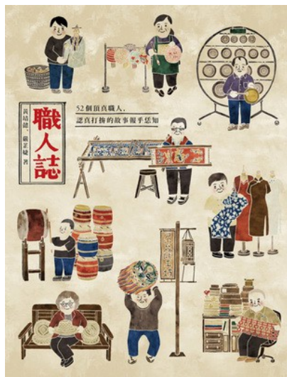
《職人誌》令人省思傳統產業面臨的問題。

事實上，如果人民或政府具有一顆想延續傳統的心，保存老一代的技藝，將不再是難題。因此透過圖文並茂的《職人誌》，每則職人的故事，若能喚起大眾對於傳統的一絲關心，甚至產生一點興趣，將看到傳統復甦的一線曙光。