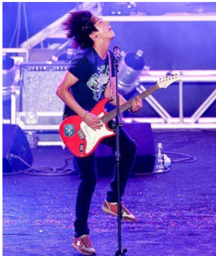
CNBLUE電吉他無接導線引發網友質疑。

「護航者」被認為是不經思考的粉絲，不論自己所喜愛的名人或是隊伍做的事情是對是錯，護航者都會為他們說話，即便是虛假的，這些護航者時常會為了支持自己所喜愛的明星，和其他網友引發激烈的辯論。在二〇一二年，義大世界邀請韓國樂團CNBLUE來台表演，被網友們發現電吉他並沒有接上導線，因而質疑CNBLUE並非現場彈奏。此事件爆發後，網路上有一名女粉絲為CNBLUE辯解，她在網路上表示那是「藍牙吉他」，不用接導線，還說不知道藍牙吉他的網友們沒常識，引起網友們的憤怒。