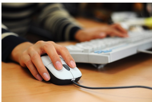
網路的普及與便利造成許多特別的現象。

不論事情發生的始末如何，結果是好是壞，某部分的網友們都一定會來批評一番，帶著酸溜溜的語氣和直接諷刺的言論或詞語，這些網友們就被稱之為「酸民」，酸民們通常會出現在各大知名論壇中，也是網路社交平台上相當常見的現象。