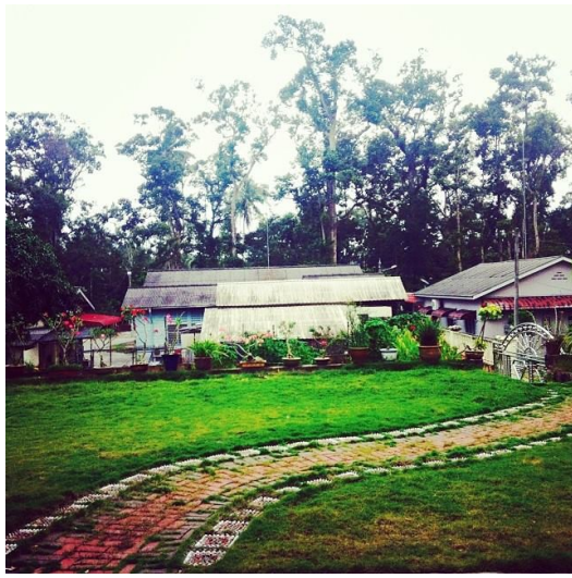
離開了避風港似的家，縱使百般不捨卻必須履行對自己的承諾。