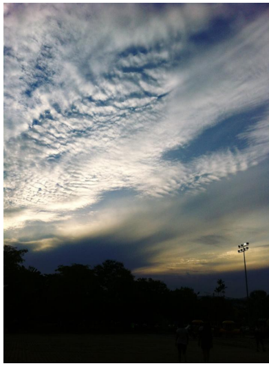
濕熱的空氣提醒了我終於回到了家鄉。