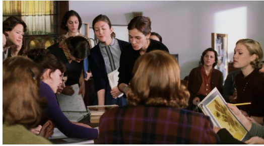
華森上課地點與題材不拘泥於傳統。