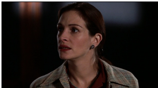
面對將答案倒背如流的學生，華森在講台前感到無措。

導演利用快速拉近華森無措的臉孔，表達她內心的衝擊，同時穿插學生的特寫鏡頭與投影片切換的畫面。並且逐漸加快節奏，配上投影片切換時所產生的巨大聲響，讓人也能親身體會華森站在講台上的無助與震撼。