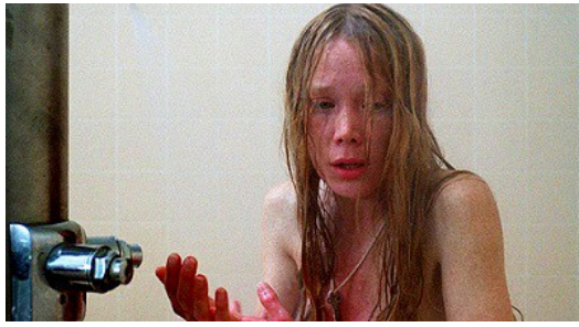
一九七四年由西西史派克所演出的嘉莉讓觀眾更融入劇情。