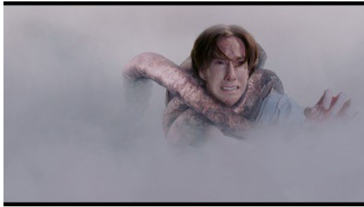
【迷霧驚魂】描述人類的自私比迷霧中的怪物還可怕。

而事實上，史蒂芬·金擅長用虛構的元素帶出他真正想傳達的意義。他的另一部作品【迷霧驚魂】將人性的自私面比擬為濃霧中的怪獸，甚至是比怪獸本身還可怕。而【魔女嘉莉】中，嘉莉的超能力可以隱喻成她的情緒和憤怒，藉由超能力的表現將抽象的情緒具體化。她使用超能力大肆地破壞，也是象徵著她所遭受的那些霸凌行為比起這些破壞還要嚴重和可怕。