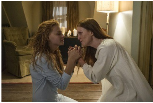
嘉莉母親同時對於宗教與嘉莉偏執的愛，為這個角色增添了不安的氣息。