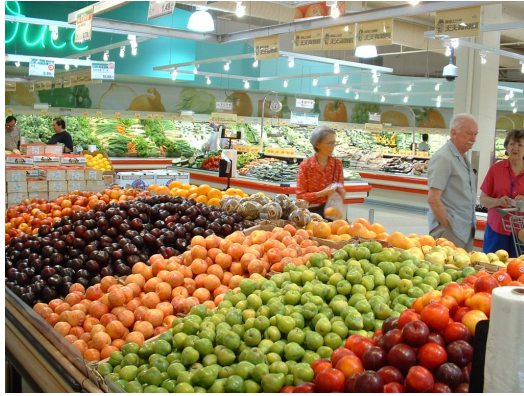
超級市場囊括來自世界各地的農作物，應有盡有。

但在超級市場中所販賣的商品，有可能是千里迢迢從其他縣市運送而來，甚至漂洋過海從其他國家海運來台，消費者無法得知他們所購買產品的生長環境，銷售員只是例行補貨上架，也無從替消費者解釋。