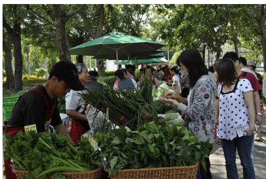
消費者保護協會與農民一同協辦農夫市集，提供消費者健康農產品。

其中成效最大的不外乎為農夫市集，所謂的農夫市集即是固定時間以及地點由農民直接販售多種少量的農產品，讓消費者能夠更認識自己所購買的食物，也提供小農生存的空間。