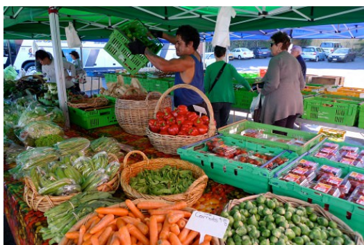
傳統市集裡缺少冷凍系統，無法販賣冷凍食品。

因冷凍食品需在低溫環境下才能確保食品的新鮮，傳統市集缺乏此類保存的設備，逐漸被現代的市場機制淘汰。又工業發展需要大量人力，許多國家為了提高生產力，透過進口糧食或機械化生產壓低國內糧價，促使小農棄農投工，也間接助長超級市場的發展，同時削弱傳統市集。