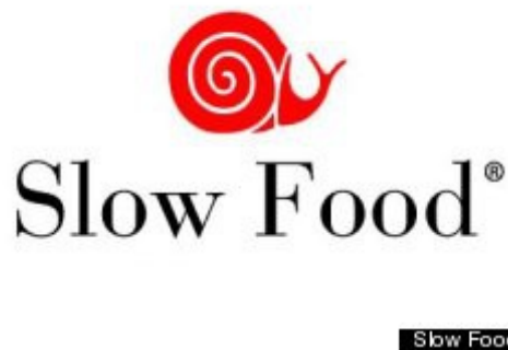
義大利慢食協會LOGO。

有鑒於此病態的飲食消費模式，義大利知名新美食家卡羅·佩屈尼成立慢食協會，提出慢生活運動的構想，主張「從生產到消費，放慢腳步，捨棄快速的大量產出」。希望能夠回歸傳統口味和風味的美好，反抗現代資本主義下工業化、機械化生產的食品，拒絕進口糧食及蔬菜，大力支持小農在地耕種在地販售。