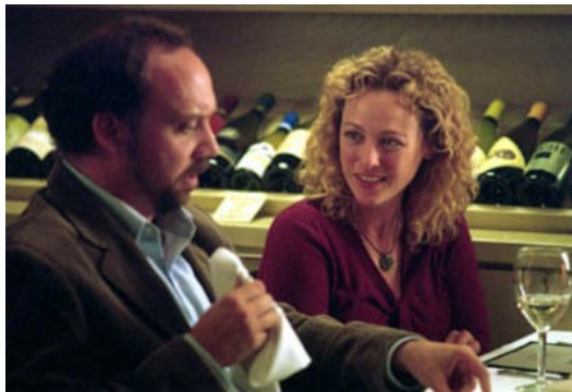
男女主角的對話玄機，為本片高潮迭起處。

另外，整齣電影的高潮迭起處即為麥斯與同樣失婚的女主角瑪雅，兩人所進行的一場對於葡萄酒的論點。麥斯訴說著自己喜愛的黑皮諾葡萄酒，瑪雅則娓娓道出葡萄酒何以讓她如此鍾情，兩人看似討論著美酒，實則為一場心靈交流，編導又一次靈巧地運用寓意豐富的台詞將觀眾帶往電影的另一個層面，窺探著主角們的內心世界。