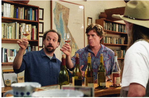
主角麥斯教導傑克如何品味葡萄酒。

也正因為劇本設定傑克是個對葡萄酒一無所知，只想盡情享受人生的男子，觀眾在看電影的過程中如同一塊海綿，藉由傑克與麥斯的對話內容，不自覺吸取了許多與葡萄酒和品酒相關的小常識而不感到生硬。