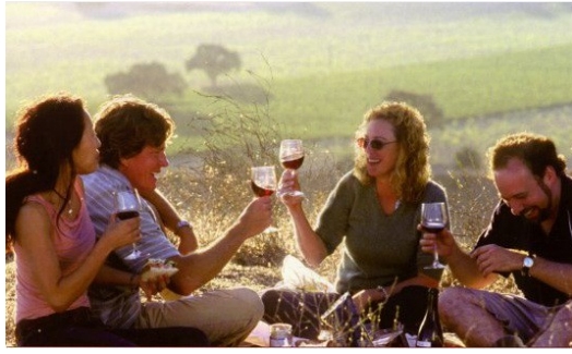
旅途中的經歷，是尋找的過程中最珍貴的價值。

電影中的兩位主角都非常的平凡，飾演主角的保羅·賈麥提、湯瑪斯·海登喬許兩位演員不是外表特別吸引人，更不常出現在螢光幕上的演員，簡直像是從日常生活中隨便將兩個人放到電影裡，這樣的普通，讓這兩個角色以及他們所遇到的事情變得更立體，也因為他們自然不造作的演出，更能讓人感同身受。不同於另一部美國公路電影【神采公路】中男主角先是遇到一位特別的魔法師，而後又經歷了一連串荒誕的事件。【尋找新方向】整部電影或許有某些橋段些許沉悶，但每個環節的細膩度都讓人著實驚嘆，寫實地呈現人生的失意。