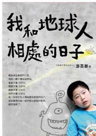
我和地球人相處的日子書影。

書裡的詞彙已經超越同齡孩子能理解的範圍，其中形容詞的用法特別令人驚豔，許多比喻使用得恰到好處，讓人彷彿走入他的內心，感受他當時的心情。