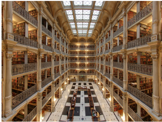
圖書館中琳瑯滿目的書，每一本都有著自己豐富的內涵。

除了當代翻譯文學類，我也讀過世界經典名著系列。讓我自己最印象深刻的是《咆嘯山莊》，事實上我會去看這部作品，是因為《暮光之城》的女主角很喜歡這本小說，時常在書中提到有關於《咆嘯山莊》中的經典名句或是劇情，這讓我感到非常好奇。經過一番掙扎後，我終於將這本世界經典名著讀完，過程其實有點痛苦，也許是我不適合看這種對話繁多，既複雜又浪漫的書吧。