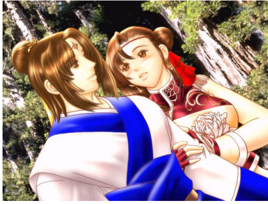
由古龍的武俠小說所改編而成的遊戲，讓沒看過小說的人也能體會其中樂趣。