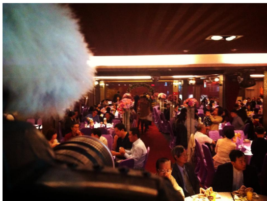
在相機後面緊張地等待最重要的時刻。