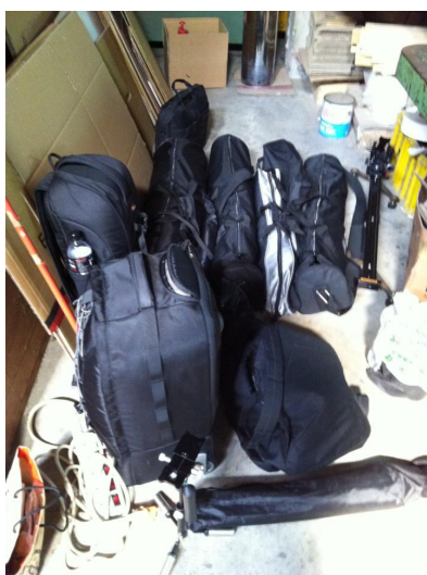
開啟超能力後，兩個人能夠背著許多器材四處奔走。

在我學會專注後，我發現，這才是真正的超能力。即使一整夜沒睡，一整天站上十幾個小時，忙到連飯都沒吃，在下班的那一瞬間，所有的疲勞、飢餓或是各種毛病才會一瞬間釋放，而這一切，遠遠比不上看見成果那一刻的成就感。專注於現在的態度，是我學到的第三課