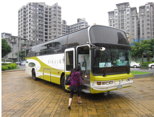
校車將客院學生在學校的兩個生活圈結合起來，但也帶給學生諸多不便。

諸如此類的對話常常圍繞在交通大學客家學院學生的生活中，因為宿舍位於新竹市的光復校區，而學院卻在竹北的六家，因此客院的學生必須仰賴校車作為往返兩個校區的交通方式。校車將客院學生在學校的兩個生活圈結合起來，但約一小時一班的固定時刻表，也帶給學生諸多不便。