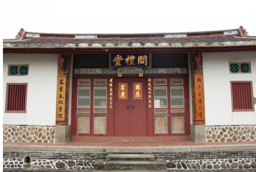
竹北市六家問禮堂為客家傳統建築，並且被列為國家三級古蹟。

就地理位置而言，國際客家研究中心具有地利優勢，研究客家族群與蒐集文史資料也較為便利，且更能深入當地文化。