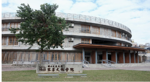
交通大學客家文化學院，外觀為客家傳統土樓建築。

而中央大學、交通大學及聯合大學也是臺灣僅有設立客家學院的三所大學，因此除了在研究方面能有較多資源外，在教學方面上相較於其他客家研究中心也更完備。可以發現，交大國際客家研究中心之研究計畫多元，並且能因應現代科技進行相關客家文化研究。然而應用於經濟產業，同時具推廣客家文化的文創產業，而其相關研究相對缺乏，因此國際客家研究中心仍有許多具發展空間的研究方向。