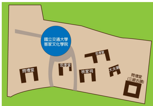
國際客家研究中心隸屬於客家文化學院，其周圍客家傳統建築群位置圖。

為了振興客家語言文化，建構客家認同的信念，行政院於民國九十年成立客家委員會。客委會為達成全球客家文化研究與交流，在民國九十二年十二月底於新竹縣成立國際客家研究中心，隸屬於國立交通大學客家文化學院，其中研究人員即為客家文化學院中的專任教師。自民國九十三年年度起至民國一〇二學年度，共計完成七十一項研究計畫。