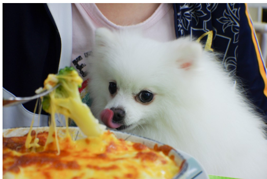
寵物餐廳提供一個讓飼主可以與愛寵同桌用餐的環境。

起初並沒有寵物餐廳這個專有名詞與經營型態，只是本身就有飼養寵物的餐廳老闆，基於愛護寵物、為寵物著想的同理心，提供寵物與飼主一同用餐、與其他飼主互相交流的環境。不過，在隨著顧客們口耳相傳與網路資訊的流通，漸漸將這種「服務」流傳開來，越來越多的餐廳開始跟進與仿效，而後才在逐漸形成寵物餐廳的經營模式。