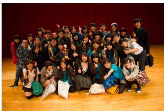
傳科系一〇五級拿下冠軍後開心合照。

而創造「二連霸」紀錄的是傳科系一〇五級和一〇六級的同學，回憶起當時準備的情形，無論是演員或是幕後的編劇與導演，每個人的嘴角上都帶著笑意，記憶猶新地談著那時的點點滴滴。