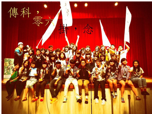
一〇六級同學們開心拿著冠軍獎盃於舞台合影，享受美好的成果。

在傳科系一〇五級和一〇六級的同學們身上，真切印證了「重要的不是結果而是過程」這句話其中的感動，團結一心的力量，將長存每個人的心底，成為大學生涯中美好的回憶。