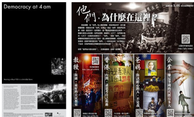
圖左為刊登於New York Times 的全版廣告，圖右則是國內的。

然而這樣的意見就在稍晚的行政院外集結，一群學生效法當初闖入立法院的作法，打算攻佔行政院，不料在凌晨遭到鎮暴警察和高壓水車強迫驅離，造成民眾流血受傷，至今仍有有人在醫院觀察。這個舉動立刻造成輿論撻伐聲浪，質疑警方執法過當。另外，警方在凌晨清場之前曾淨空所有媒體記者，讓人質疑有「先關燈、後打人」的嫌疑，雖然媒體無法蒐證，但是仍有許多民眾用隨身的裝置記錄下過程，散佈在網路上要大家知道真相，甚至引起網友發起募款購買蘋果日報、紐約時報國際版和自由時報的頭版，要讓暴力鎮壓的真相公諸於世。