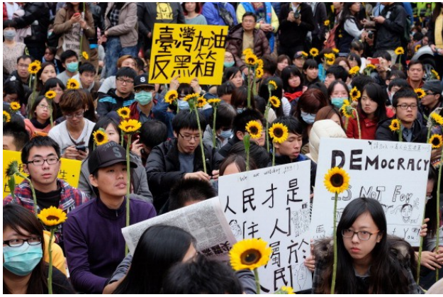
儘管每個人各執不同標語，但對臺灣這塊土地的熱愛是共同的。

即使在短時間內，這個社會運動無法收尾，可是這場運動讓臺灣人民看見自己不同的一面、如出一轍的團結。在無數話題如太陽餅、香蕉和鹿茸之下，台灣人民必須真正面對眼前所看到的問題，正視這個服貿協定會造成如何的衝擊。