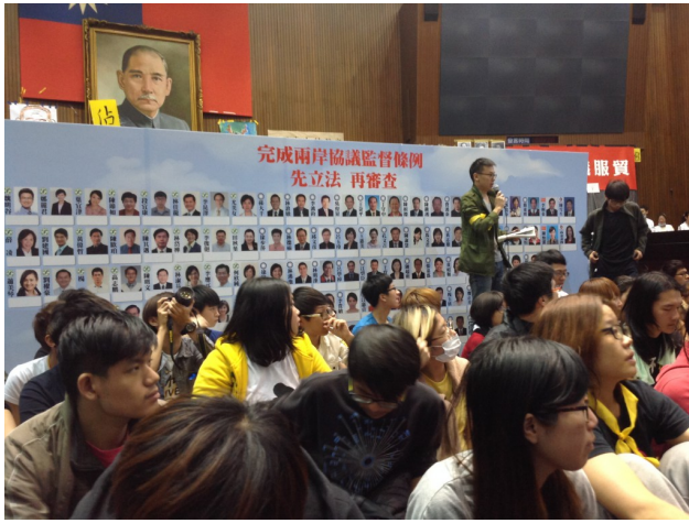
學生代表將——向立委發送承諾書，並要求立委在看板上簽字同意。