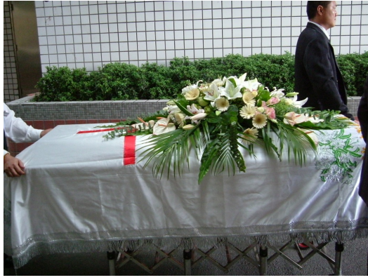
許多人在生命走到最後才開始省思人生的意義。

「世界上很多事是很急迫但不重要的，也有些事是不急迫但很重要的。」老爹時常會很感嘆地跟我說：「當你不明白生命的意義時，其實你做什麼都很無感，很無力，因為你根本不知道你在為何而戰。」