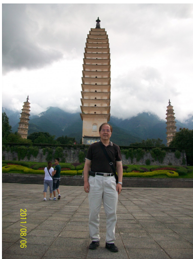
古老的廟宇至今仍是老爹喜愛造訪之處。

老爹向來對佛教和道教感興趣，一方面因為這是台灣的主要宗教，另一方面則是文化的相似性，不管是神話故事或是廟會習俗，都讓他備感親切，直至今日，每當全家經過寺廟時，老爹還是會忍不住跑到寺廟裡，研究該廟的主神為何，對廟的座落方位和設計原因滔滔不絕一番。也因為這份對生命探詢的熱誠，在聽講傳說故事之餘，老爹開始對佛道兩教做更深入的研究。