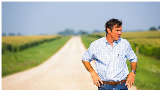
主角亨利與兒子狄恩吵架完後非常懊悔。

在父子發生衝突之後，導演利用一望無際的農田作為轉場畫面，表達角色因溝通失衡產生的內心距離感，就如同大規模的機械式生產後，農人與人之間的距離也越拉越大。