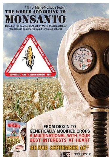
紀錄片【孟山都眼中的世界】封面照，諷刺孟山都不實廣告。

【玩命代價】與【食品帝國】、【孟山都眼中的世界】皆向人民揭發基因改造作物的內幕，不同於後兩者使用的是紀錄片的方式，而【玩命代價】則是用虛構的故事描繪當今農業受到基改的影響，片中也利用虛構的自由種子公司影射全球最大種子公司孟山都，並將其實際惡行加入劇情中，讓人有種亦真亦假之幻覺。