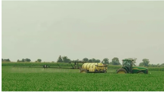
劇中主角機械式地耕種。

而這樣困境不只出現在農業，畜牧業中也常發生，在二〇〇九年的紀錄片【食品帝國】中提到，在工業革命後，為了降低成本，不只農作物的種植，連家畜的養殖也開始機械化，然而要建造一座機械化的養雞場需要五十萬美金，但一般雞農平均一年收入為一萬八千元美金，因此，許多雞農因背負著債務而受制於大企業，只能配合其發展而非天然養殖。