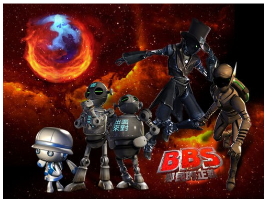
將網路論壇中所發生的事情用3D的動畫表現，再搭配現實的場景，形成一種新的風格。

女主角因為收到多封網友傳送的簡訊辱罵，精神壓力難以承受並決定要跳樓自殺，「我要讓他們知道，他們曾經用BBS殺死一個女孩子」這句話提醒著觀眾，不論在網路虛擬世界如何，電腦的另一端，也是個活生生的人類。