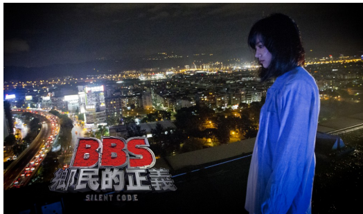
【BBS鄉民的正義】一片中，提及到許多現今網路論壇的次文化，也帶出許多議題。

整部電影一開始是以倒敘法的方式，講述一名記者被上司逼迫，必須從「BBS論壇」上找新聞，進而遇到整件事情，也一步步揭開並挖掘真相。在電影裡時常會出現網路通用的術語，比方說「酸民」或是「頭香」之類的詞，讓有使用網路的觀眾們感到熟悉，更快速的進入整部劇情的狀況。然而【BBS鄉民的正義】所要表達的，不只是單純的網路文化而已，還有其背後的正確性，在電影中，記者問過一句話，「你怎麼能確定網路上匿名發表的言論沒有任何問題？」這句話不只接續著後面的劇情，也是在對著觀眾們說。