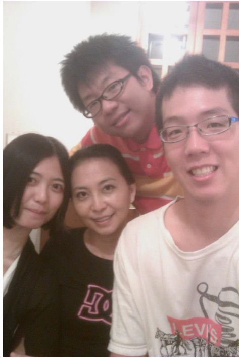
男孩的古典鋼琴老師（左二）不僅僅是音樂上的啟蒙者，更是人生當中的重要諮商