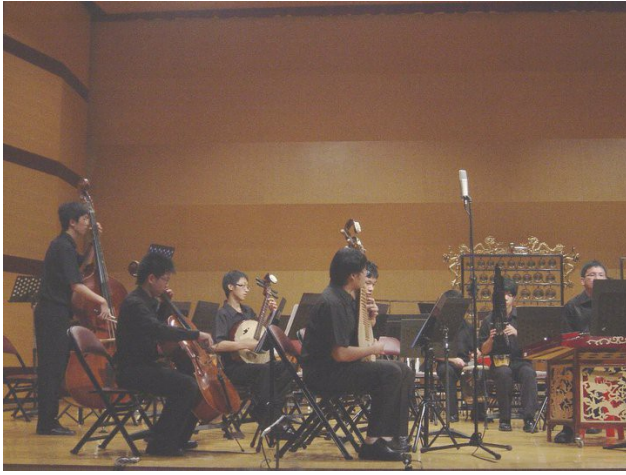
國樂社的演出形式多元，讓男孩大開眼界

以前男孩以為學習國樂的人大概都是老年人一輩在學的，演出的場合大多是很多人忌諱的喪禮場合。但是國樂社裡演的音樂卻完全不是這麼回事，原來國樂也有和弦樂團一樣一起演奏的合奏精神，也有優美動聽的旋律，絕對不只是出殯才聽到的嗩吶咆嘯。這讓男孩開了眼界，也讓男孩對於不同音樂的接受態度有多的包容空間。