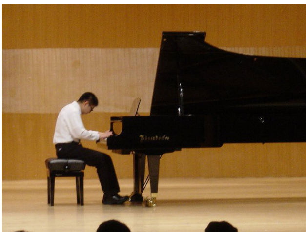
鋼琴，是男孩學習音樂的媒介，也是精神寄託之一

彈鋼琴時大概是男孩最快樂的時光，儘管對於只是初學的男孩而言，他彈的都只是簡單卻動聽的卡通動畫主題曲，【埃及王子】、【獅子王】、【小美人魚】等等，在琴鍵上彈過一遍又一遍，那種對於音樂最單純的感動是促使男孩練琴的動力。這也是為什麼儘管與妹妹同個時間被送去學鋼琴，但是最後卻是男孩一路學到了高中畢業，妹妹則是小學畢業就棄鋼琴而去。