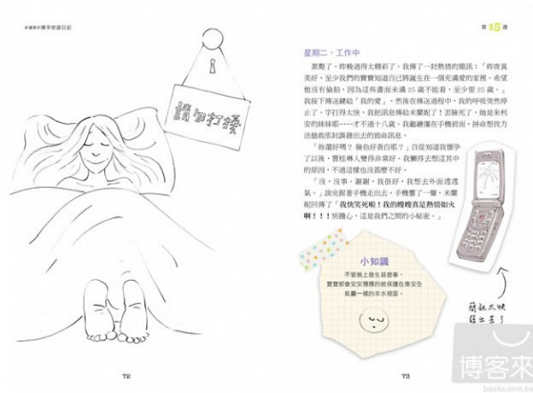
《妙麗葉的懷孕慾望日記》為圖文書籍，透過圖文配合，大方地面對性慾與性事。