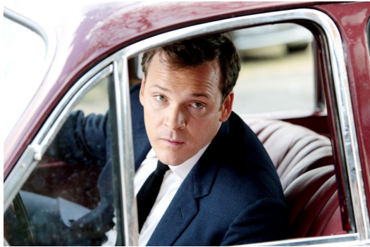
大衛的出現，帶給珍妮一連串衝擊。

第二個衝擊則在大衛向珍妮求婚時出現。當她將這個消息告知父母，出乎意料地，他們關心的是對方的身分，而非「結婚後能否上大學」。明明將「上大學」奉為最高目標的父母，居然能在一瞬間揚棄灌輸女兒十多年的理念。因為實際上在他們的觀念裡，「牛津」不過是幫助女兒嫁得更好的踏板。