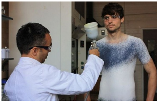
西班牙設計師馬尼爾托雷斯發明的「噴罐布料 (Fabrican)」。

科技來自於人性，搭上環保的風潮並運用可再生的材質，除了讓消費者可以自製喜愛的服裝設計，創造獨一無二的自我風格，也免除成衣製程中的耗時費工與可能產生的汙染。