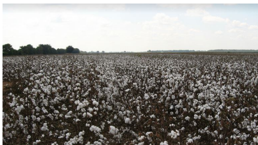
棉花栽種面積廣大，需噴灑大量農藥維持生長。

人們身上不可或缺的衣物，有50%的布料是以棉花做為原料，然而傳統種植下的棉花，卻是環境的屠宰者。根據專門從事生產有機棉布的綠天下有機棉公司指出，棉花種植面積僅占全球農地的2.4%，但棉花田內的農藥使用量卻達到了全球農藥總用量的20%。其中，除了採收前的落葉劑，還使用大量的殺蟲劑和除草劑，不但過度殺害了土壤中有益或無益的生物、污染了土壤及地下水，也對農民及居民產生了生命威脅，對環境的傷害不容小覷。