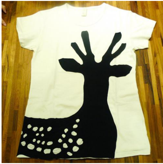
由有機棉製成的上衣，其簡約的設計風格，也符合環保的概念。