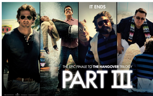
【醉後大丈夫】出乎意料地推出到第三集，打破過去喜劇片紀錄。

【醉後大丈夫】二〇〇九年上映之後，出乎意料地成為當年的票房黑馬，也因此分別在二〇一一年和二〇一三年由原班人馬合作再度推出續集，續集的票房也都十分亮眼，但在電影劇情與角色戲份上卻各自有不同的轉折。