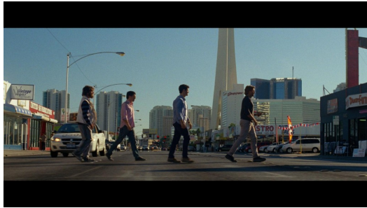
電影中出現了四人過馬路的畫面，導演似乎是在向披頭四致敬。

【醉後大丈夫3】艾倫隱隱約約地成為最重要的主角，觀眾像是陪同他一起進入一趟成長的旅程。第三集也套入公路電影的公式，一群大男人開著車冒險，意外地在旅途中因為衝突和情感而有所成長，除了發覺他們內心最良善的一面，也重新回到現實，拾起責任的包袱。從原本外表成熟，內心卻幼稚無比；整天胡思亂想著要逃離現實的大叔們，正式蛻變成爲有肩膀而穩重，願意承擔生活和責任的大男人。