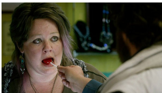
眼神與糖果的交流，是這場戲最重要的元素。

一場艾倫與心愛的人邂逅的戲，導演使用十分幽默的方式展現。首先是艾倫深情款款地看著女生吃著棒棒糖，用他的舌頭在糖果上翻來繞去，接著他將棒棒糖遞給女生，那位女士重複著相同的動作。顯示出兩人的情感正不受阻撓地交流，這樣的舉動或許在每個人心中感受不一，但導演運用的方式卻能夠在觀眾腦海中烙印下深刻的畫面。