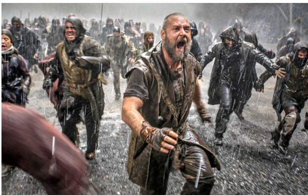
【挪亞方舟】場面浩大，更運用許多好萊塢常用的特效。

但如前所述，近年來由於歐美基督教人口遞減，對聖經背景了解或感興趣的觀眾正在逐漸流失，因此，以聖經為題材的電影為了能更進一步觸及非教徒而不論於老掉牙的傳教的性質，許多這類型的電影開始做出調整以符合觀眾的口味，如【挪亞方舟】即是一例，運用動畫特效營造出大洪水毀滅世界的壯闊，並將原始的故事做適度的延伸與轉化，讓故事中Biblical（泛指與聖經相關）的寓意更能適用在現代人身上。