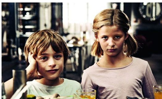
電影藉由孩童視角，讓大人們去正視自己的問題。

除此之外，整部電影的配樂在配樂上十分特別，主要都使用比較搖滾的音樂，陪襯有趣到有點荒誕的劇情。有時一幕之中不只單一首音樂，還疊入不同樂器元素，最初聽到時會有些不和諧的感受，隨著劇情發展卻越能進入狀況，不同層次的配樂彷彿代表著不同角色的心境，有時甚至讓人有種情緒是隨著配樂轉換，而非電影的畫面流動。