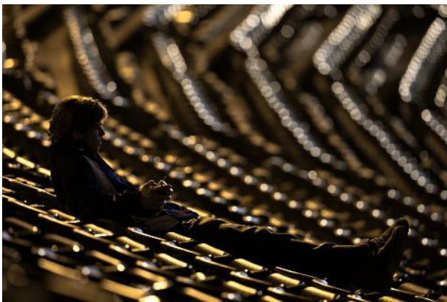
偌大球場與獨自一人的場景形成強烈對比。

電影開場是由主角晚上獨自一個人坐在空蕩球場的畫面，偌大的球場設施比起主角一人，更能顯得主角心中的空虛感。在電影中段，隊伍隨著主角心目中建隊模式慢慢邁向成功，在創下破天荒的二十連勝後，全美都在討論一個小市場球隊是如何辦到如此成就的。而前程似錦的奧克蘭運動家隊與當時釋懷的主角，也讓整部電影的情緒達到最高點。