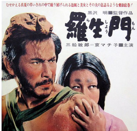
電影【羅生門】的角色，為維護自己利益，選擇不說實話。

在鏡頭的使用上，【羅生門】使用長鏡頭運鏡，拍攝人在樹林間穿梭，呈現所走的路之漫長，以及讓觀眾隨著劇情的推展堆疊不安的情緒，而在爭鬥畫面，則是以短鏡頭相互交錯呈現打鬥時的刺激感。而【白雪公主殺人事件】則是在開頭進入美妙幻想，結局時運用長鏡頭，表達雖然前方是未知的路，但還是要一直走下去，而其他地方藉由短鏡頭切換畫面，塑造觀眾緊張懸疑感。